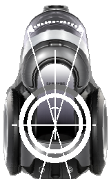
Wendigkeit Schwenkbarer Korpus