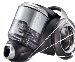
Leichte Lauf Überwindet leicht niedrige Hindernisse